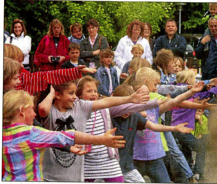
Schulfest in Parsau: Mit Tanzeinlagen ...

Neben einigen Verkaufsständen mit selbstgebastelten Dekorations-Artikeln, die sich um den Schulhof platziert hatten, bot der Förderverein Gegrilltes an. In der Aula gab es eine Tombola mit Gewinnen für jung und alt, die von einigen örtlichen Geschäften gespendet worden waren. Von vielen Eltern gespendeter Kaffee und dazu selbst gebacken Kuchen und Torten in einer Vielfalt, die jeder gut sortierten Bäckerei zur Ehre